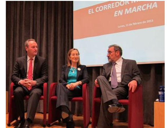
Jornada de Cierval Valencia, 11/02/2013

Ana Pastor, Ministra de Fomento: “El Corredor Mediterráneo debe ser un compromiso y un pacto entre todos”, en referencia a Administraciones Públicas y empresarios, con el objetivo de "generar riqueza y mejorar la competitividad del país”.